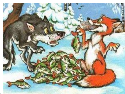
В. В. Лиса и волк

Б2. Найдите соответствия изображения храма в 1 столбике и принадлежность к религиозному верованию во 2 столбике.