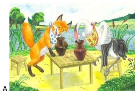
А. А. Лиса и журавль